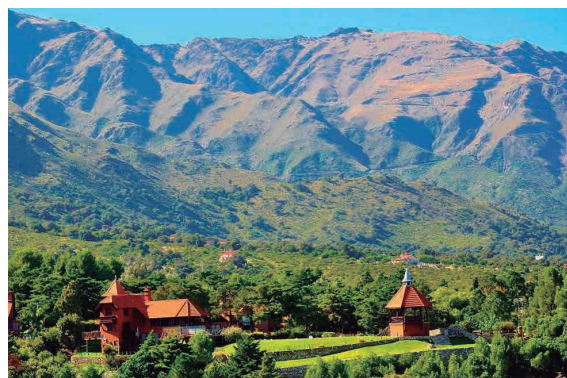
MERLO - SAN LUIS