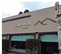
HOTEL CLIMA SOL