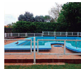
HOTEL CLIMA SOL